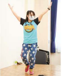
ダンス フィットネス