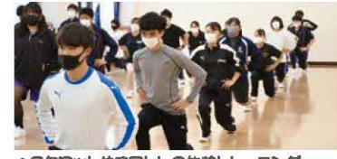
▲スクワットやコアトレの体幹トレーニング